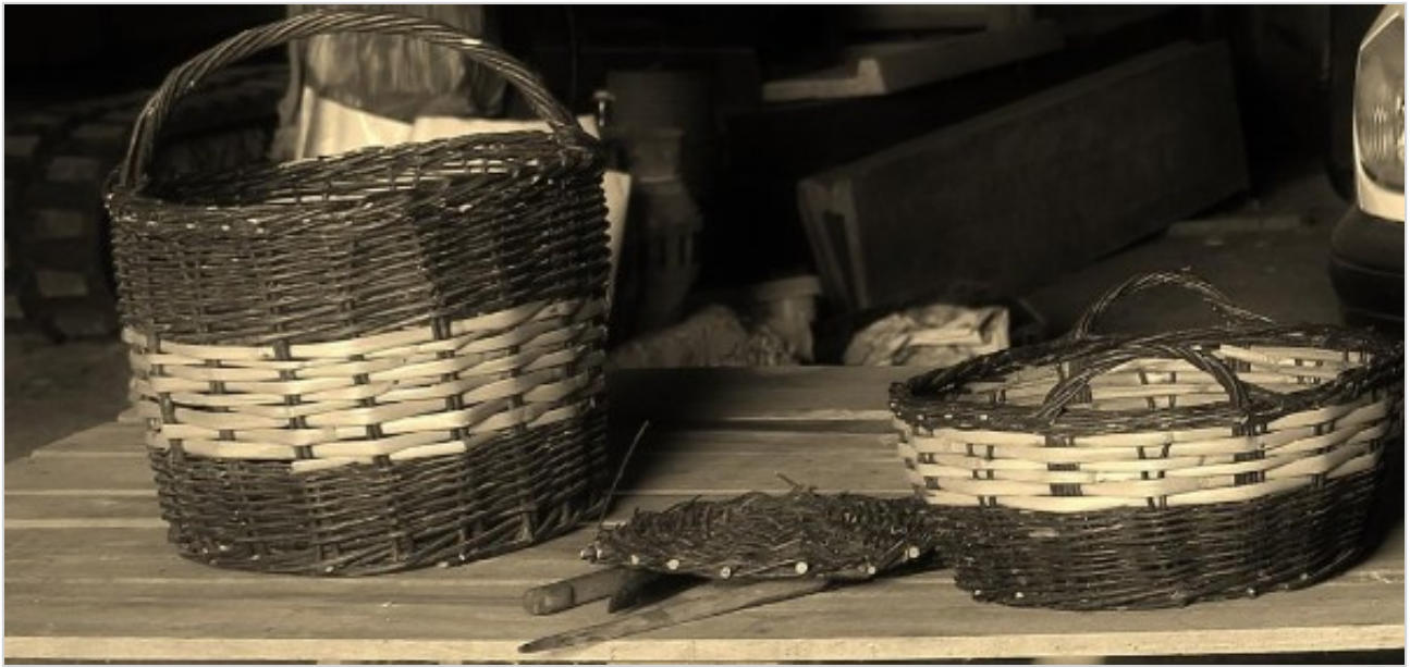
Article rédigé par Arlette DARBAS