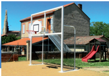
L'école & l'aire de jeux