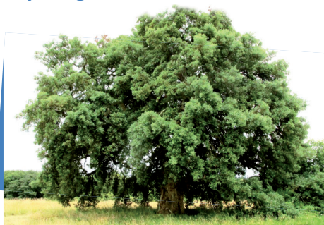
Le chêne liège