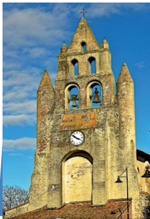
L'église du moyen âge