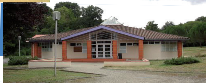
La salle des fêtes