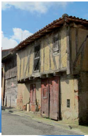
La maison à colombages